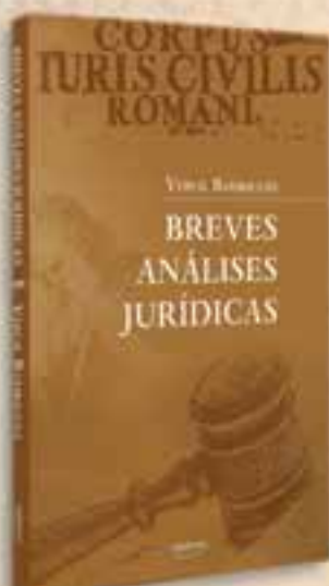
BREVES ANÁLISES JURÍDICAS