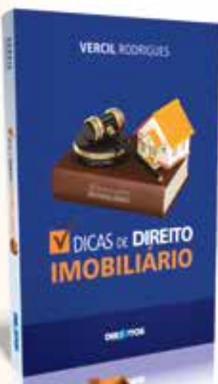
DICAS DE DIREITO IMOBILIÁRIO