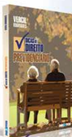
DICAS DE DIREITO PREVIDENCIÁRIO