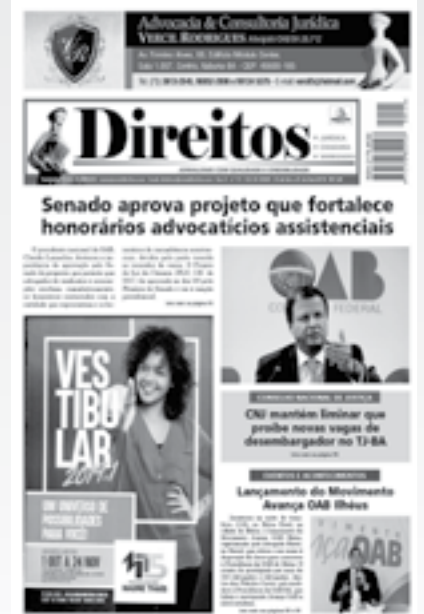
JORNAL DIREITOS, O PRIMEIRO JORNAL DO INTERIOR DA BAHIA COM ISSN E CÓDIGO DE BARRA

NOSSO CRESCIMENTO É FRUTO DE MUITO TRABALHO, ALIADO A COMPETÊNCIA, SERIEDADE E HONESTIDADE