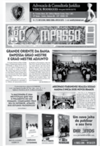
JORNAL O COMPASSO, O JORNAL DO MAÇOM DA BAHIA

NOSSAS PUBLICAÇÕES VOCÊ ENCONTRA NAS PRINCIPAIS BANCAS DO SUL DA BAHIA