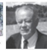
Gr.: Inspetor Litúrgico da 3ª Região Litúrgica da Bahia. Orador da ARLS Areópago Itabunense e 1º Vigilante da ARLS Acácia Grapiúna. Itabuna – Bahia.